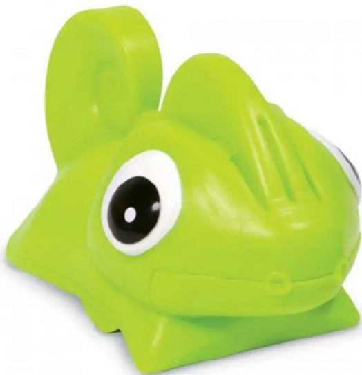
Kódovací zvířátka Go-Pets