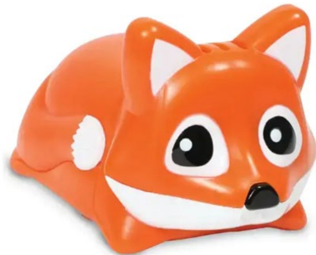
Kódovací zvířátka Go-Pets